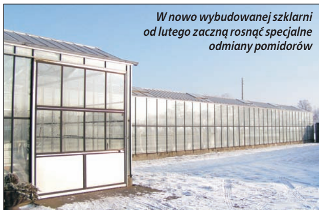
W nowo wybudowanej szklarni od lutego zaczną rosnąć specjalne odmiany pomidorów

mogę tam zasięgnąć rady, jak postępować z własnymi finansami i naprawdę wychodzę na tym dobrze. Bank niejednokrotnie mi pomógł przy rozwoju gospodarstwa i przy zakupie ziemi. Doradztwo takie jest dla mnie bardzo cenne.