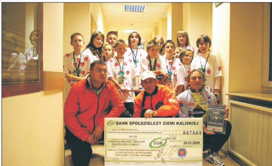
Uczestnicy Sztafety w studio TVP