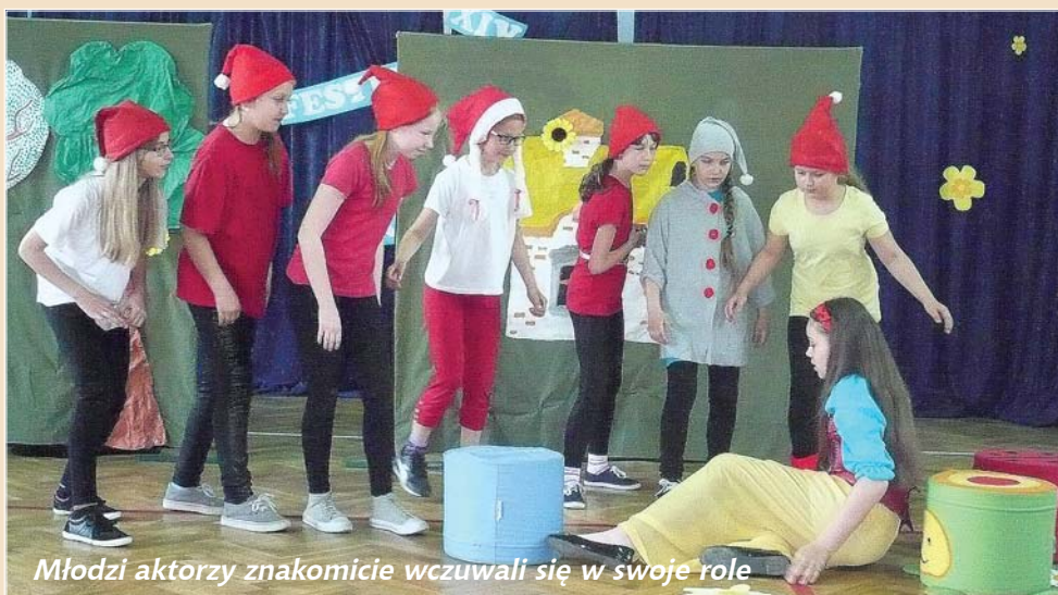
Młodzi aktorzy znakomicie wczuwali się w swoje role