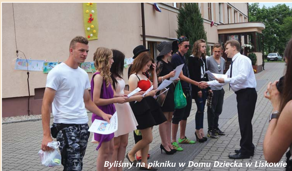
Byliśmy na pikniku w Domu Dziecka w Liskowie