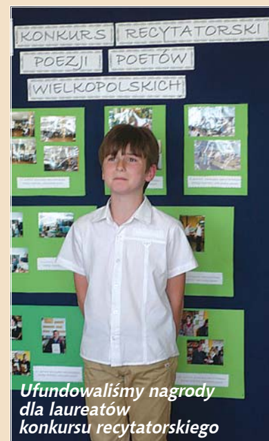
Ufundowaliśmy nagrody dla laureatów konkursu recytatorskiego