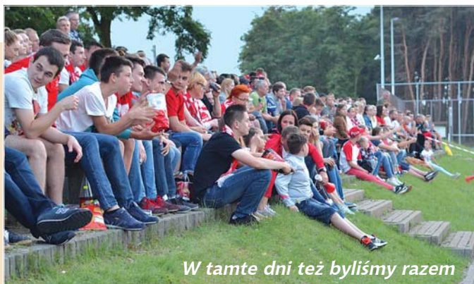
W tamte dni też byliśmy razem