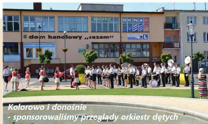
Kolorowo i donośnie - sponsorowaliśmy przeglądy orkiestr dętych