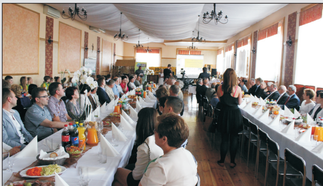
Zgromadzeni goście na Jubileuszu Klubu