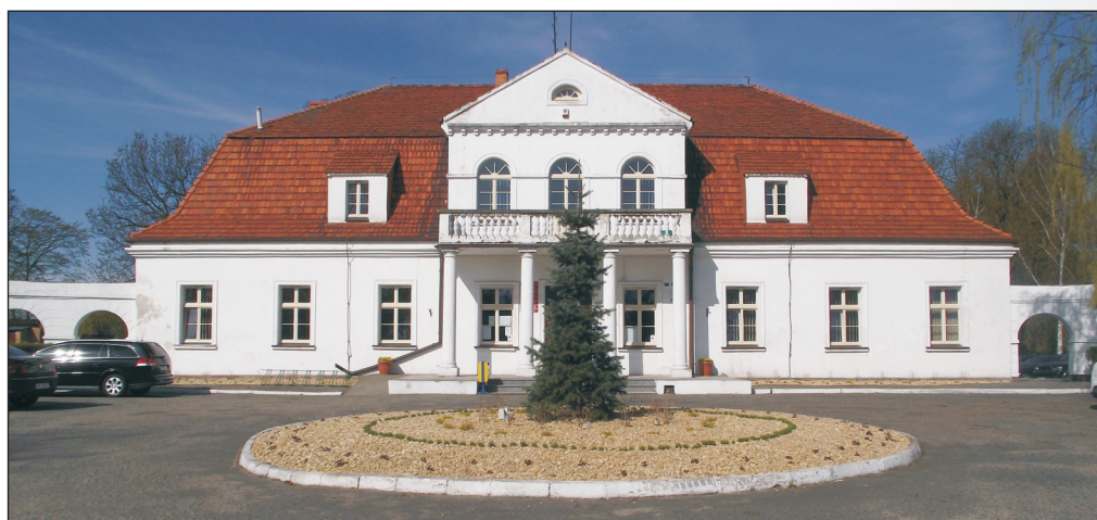
Siedziba Urzędu Gminy

– Jeszcze przed laty w każdej z bibliotek dla młodzieży urządziliśmy nieodpłatne kawiarenki internetowe. W przyszłym roku planuję udostępnienie bezpłatnego Internetu w domu każdemu uczniowi w naszej gminie.