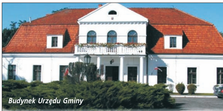
Budynek Urzędu Gminy

– Bank ma siedzibę w centrum Żelazkowa. Przez ostatnie lata współpracujemy z nim w zakresie obsługi budżetu gminy i nie ukrywam, że jest to bardzo dobra i owocna współpraca.