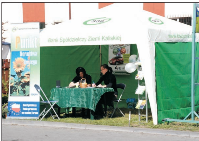
Stoisko BS Ziemi Kaliskiej na XII Wiosennych Targach Ogrodniczo-Rolniczych i Działkowych w Opatówku