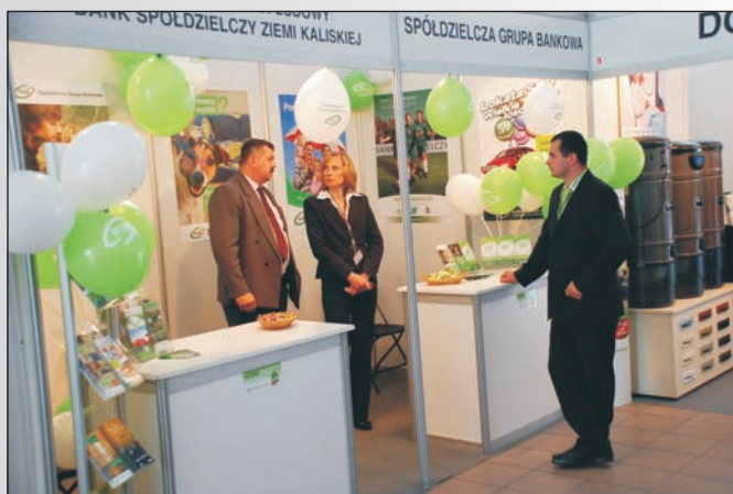
Swoją ofertę Bank przedstawia na XIV Targach Budownictwa, Nieruchomości i Wypożyczenia KALBUD