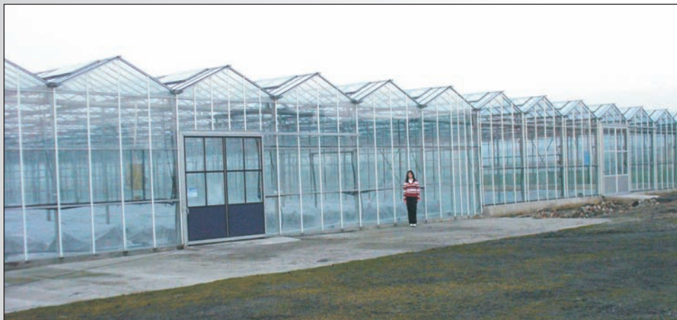
Szklarnie w gospodarstwie zajmują prawie 6 tys. m 2