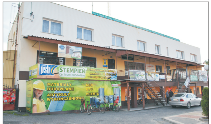
Budynek administracyjno-usługowy Spółdzielni wybudowany przed dwudziestu laty

pierze, jajka, skórki królików, płody rolne, owoce i warzywa, oferowała usługi transportowe, prowadziła masarnię, piekarnię, której wypieki zjadało 17 tys. mieszkańców obu gmin oraz część gminy Szczytniki. Prowadziła handel detaliczny w kilkudziesięciu sklepach, sprzedawała też węgiel, nawozy i środki ochrony roślin. Duże dochody przynosiła spółdzielni kooperacja z pobliskimi zakładami przetwórczymi Winiary, dla których geesowska masarnia dostarczała odkostnioną wołowinę do konserw. Kres tej koopera-