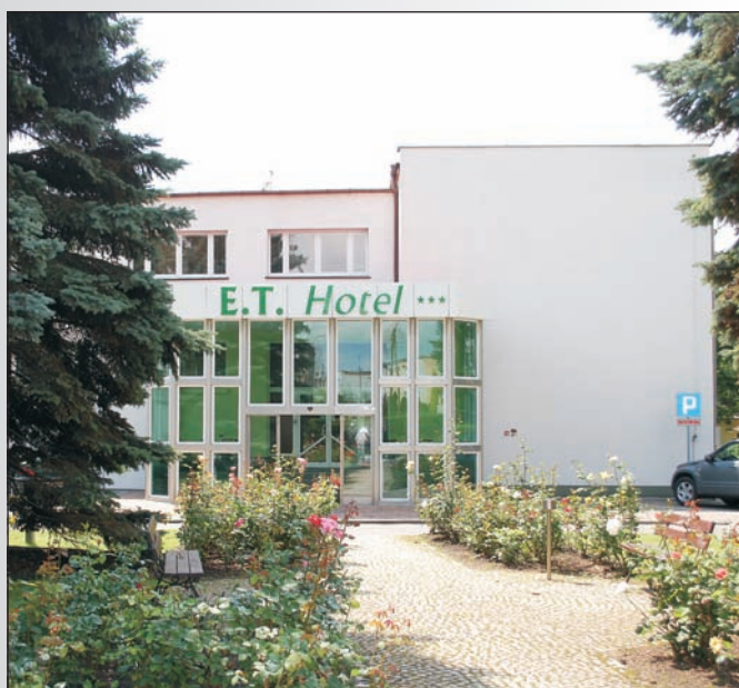
E.T. Hotel przy ul. Tuwima w Kaliszu