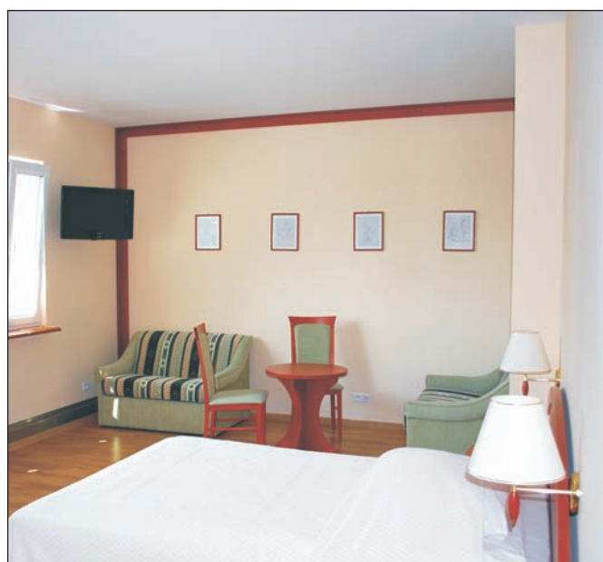
Widne i wygodnie urządzone pokoje gwarantują dobry wypoczynek