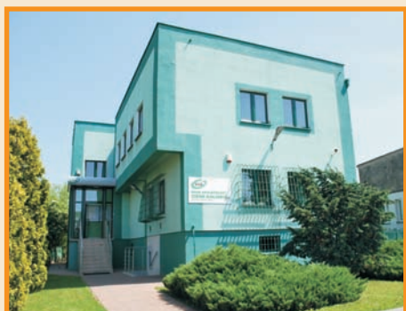
Siedziba Oddziału w Szczytnikach