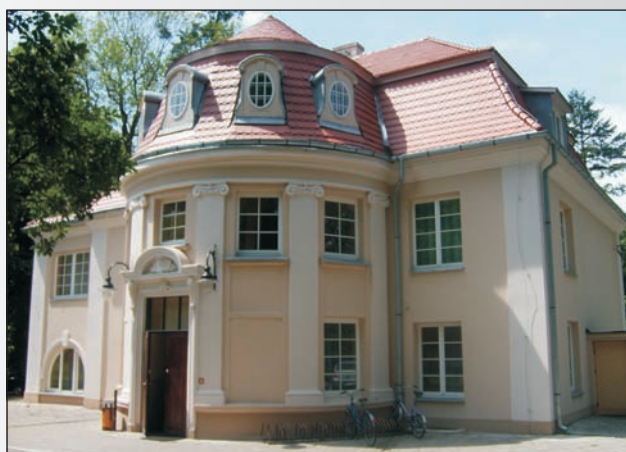
Zabytkowy pałac – obecnie siedziba Urzędu Gminy