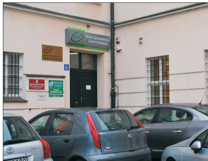
Wejście do Oddziału w Kaliszu