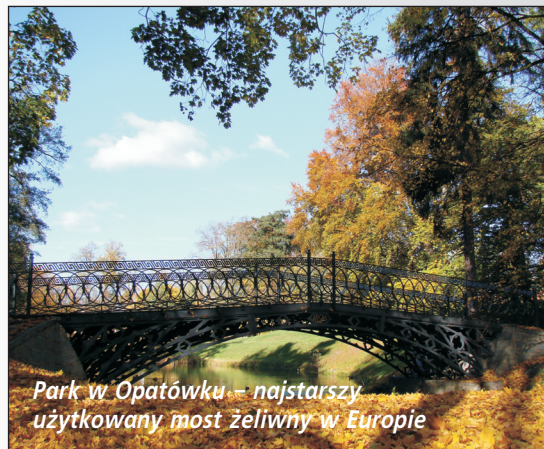
Park w Opatówku – najstarszy użytkowany most żelazny w Europie