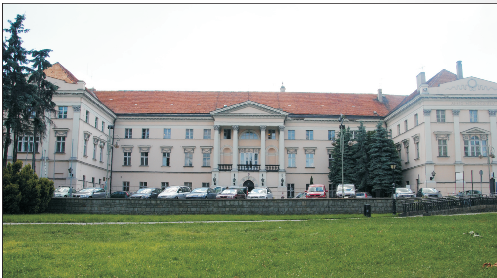
Siedziba Starostwa Powiatowego w Kaliszu

Na rynku mamy dostęp do ofert bankowych pochodzących z wielu instytucji finansowych. Chodzi jednak o to, żeby były to instytucje otwarte na potrzeby klientów, a takimi są banki spółdzielcze, które sprawdziły się w czasie ostatniego kryzysu i jako jedyne nie ograniczyły akcji kredytowej.